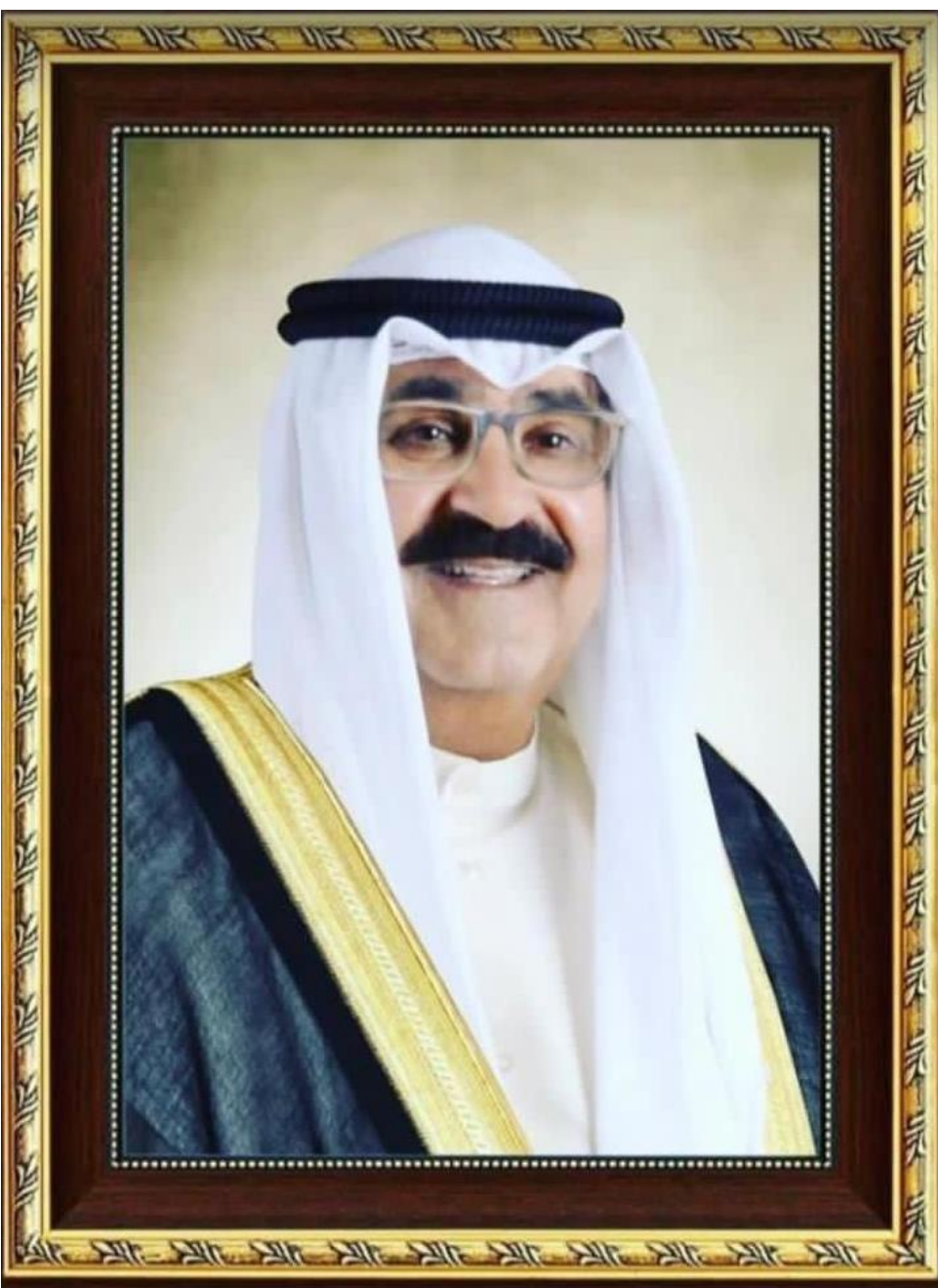
سمو الشيخ مشعل الأحمد الجابر الصباح ولي عهد دولة الكويت